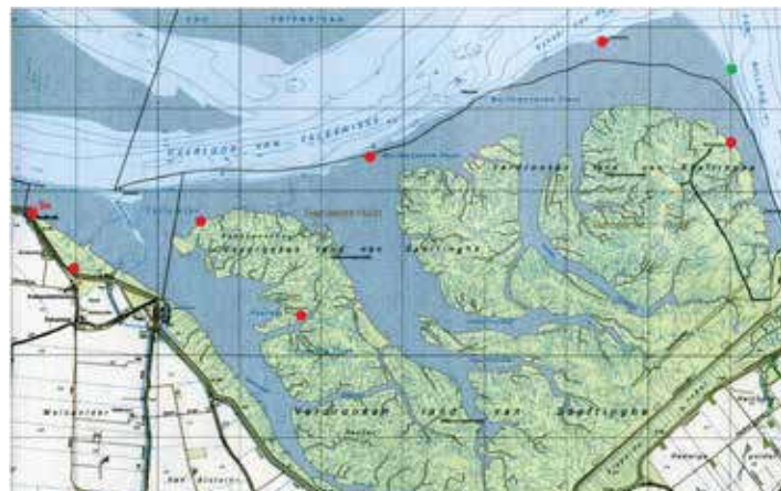
Kaart van Saeftinghe met vondsten en waarnemingen 2000-2016