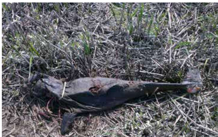
De aangespoelde bruinvis in de Spauwer.

Sedertdien is er veel veranderd. De onbeperkte lozingen vanuit de industrie en van huishoudelijk afval zijn grotendeels een halt toegeroepen. Gedurende de jaren 1980 zien we in de rivier een voorzichtig herstel van de visstand. Dat herstel heeft zich tot in onze tijd voortgezet. Volgend op dit herstel nemen ook de zeehonden terug toe, eerst alleen volwassen dieren, later worden er op de platen weer jongen geboren. Momenteel leeft er een honderdtal zeehonden in de Westerschelde. De bruinvis herstelt zich ook maar minder opvallend dan de zeehond. Deels komt dat doordat deze walvis het grootste deel van zijn leven onder water doorbrengt. Zichtwaarnemingen en vondsten zijn er vooral uit het westelijke deel van het estuarium. Vanaf de vogeltelpost bij Breskens krijgt men vrijwel dagelijks