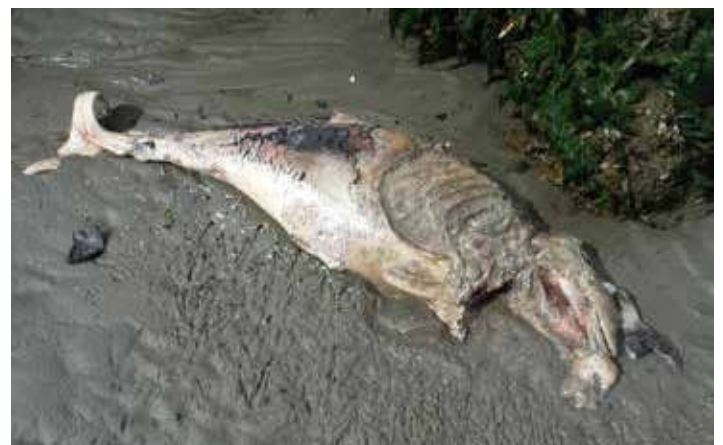
De aangespoelde bruinvis van De Noord.